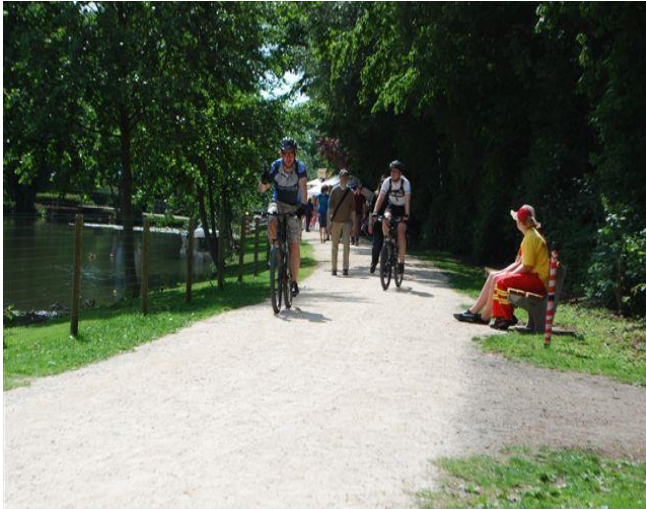
Oberursel im Taunus