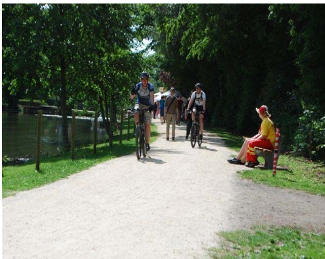
Oberursel im Taunus