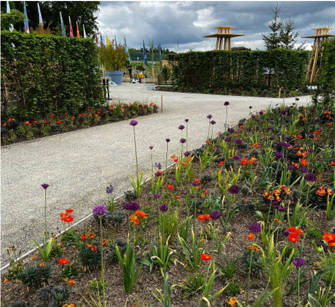
Beispiel Landesgartenschau Freyung