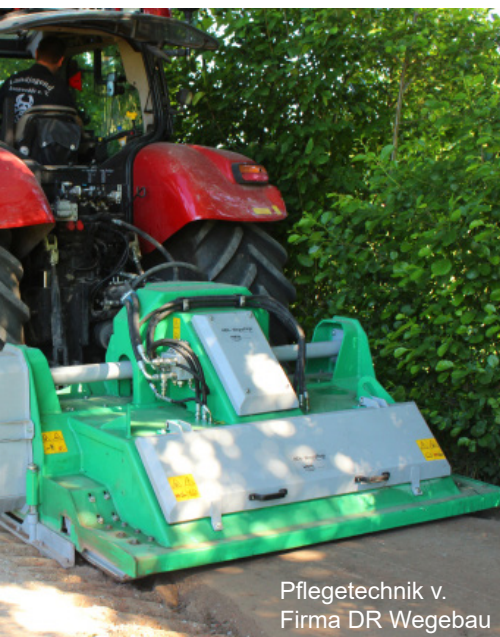
Pflegetechnik v. Firma DR Wegebau