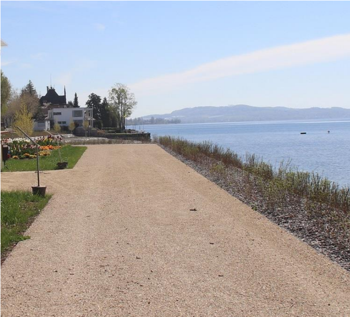
Beispiel öffentliche Parkwege